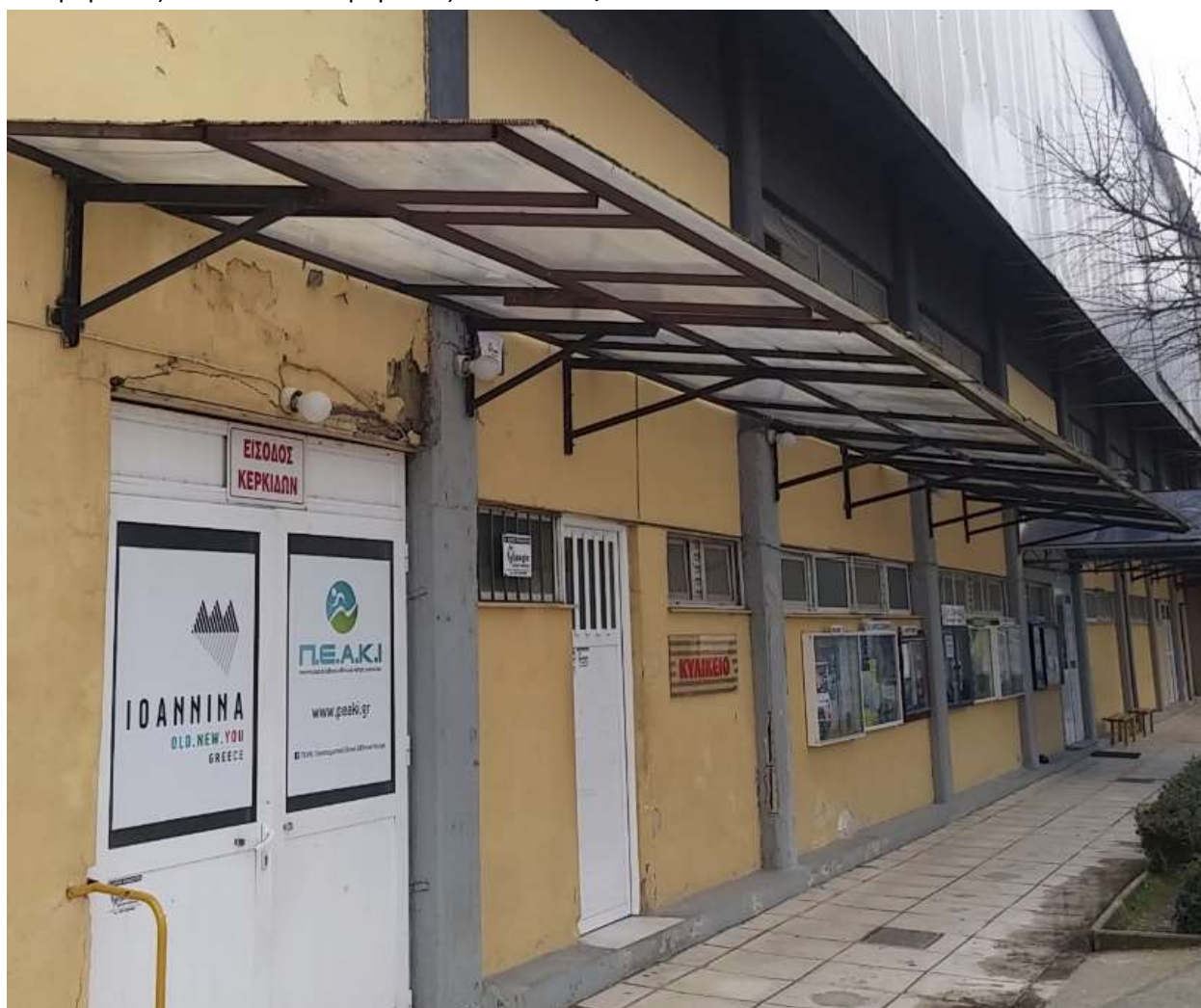
Εικόνα 2. Εξωτερικός χώρος κολυμβητηρίου

14 προβολείς x 1000W + 18 προβολείς x 250W= 25,93kW .