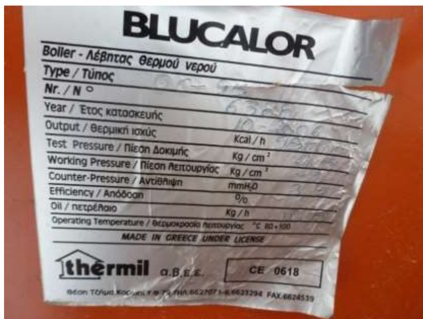
Εικόνα 5. Λέβητας 4 στο μικρό λεβητοστάσιο του κολυμβητηρίου

Το θερμό νερό από τους λέβητες 1 και 2 καταλήγει στον κεντρικό συλλέκτη προσαγωγής από τον οποίο αναχωρούν οι εξής κλάδοι: