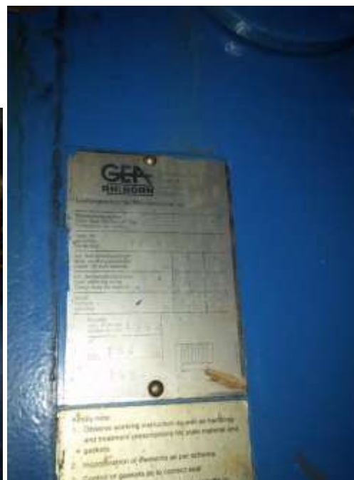
Εικόνα 8. Εικόνες από τον εναλλάκτη της μεγάλης πισίνας