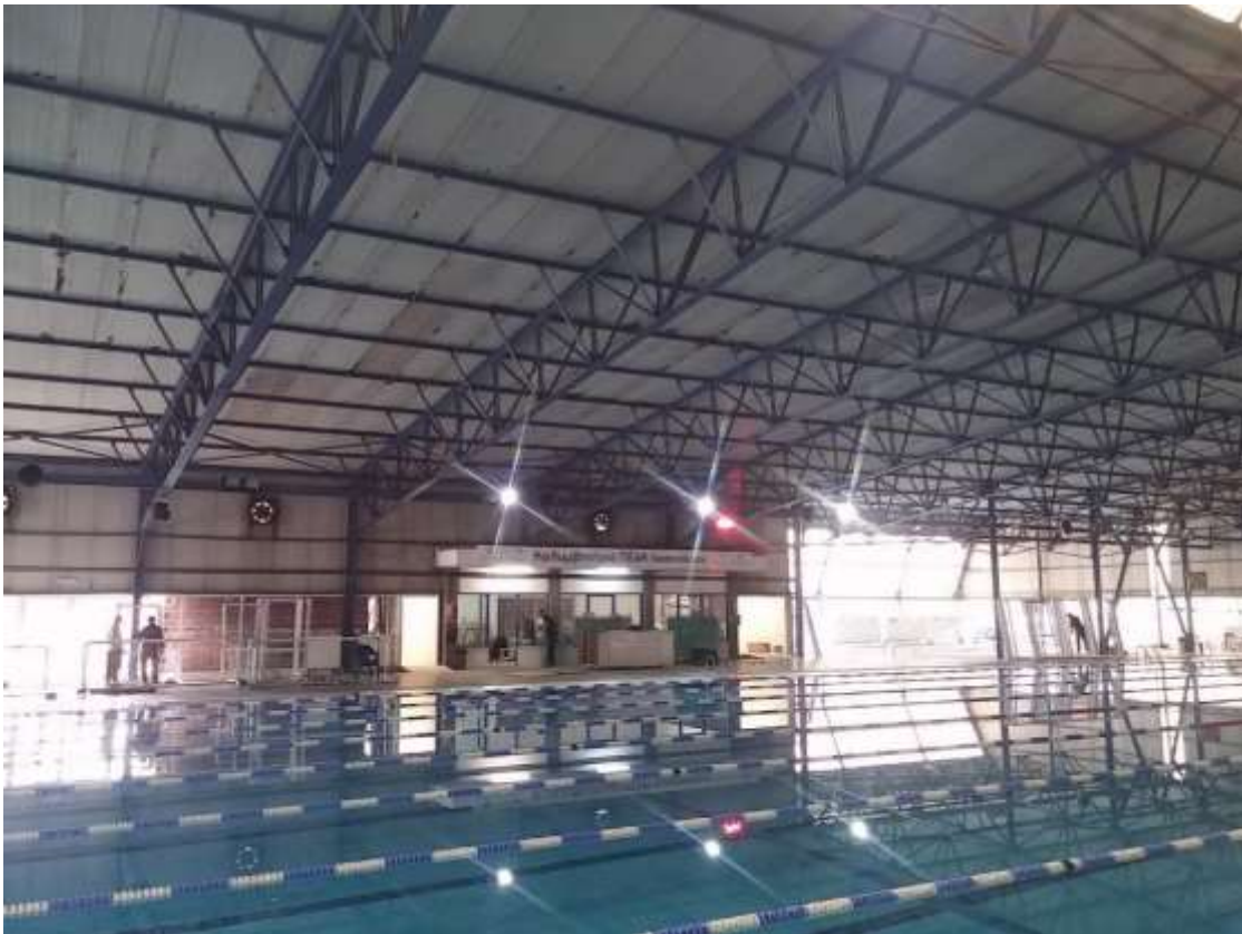
Εικόνα 12. Αξονικοί Ανεμιστήρες Εξαερισμού

Στις κερκίδες του κλειστού κολυμβητηρίου Ιωαννίνων είναι εγκατεστημένα εννέα (9) αερόθερμα με αξονικούς ανεμιστήρες. Όπισθεν των ανεμιστήρων υπάρχουν αντίστοιχα εννέα (9) στόμια λήψης νωπού αέρα για την εισαγωγή νωπού αέρα στον κεντρικό χώρο του κολυμβητηρίου. Κάθε ανεμιστήρας μπορεί να εισάγει 4.500m 3 νωπού αέρα κάθε ώρα. Ο αέρας που εισάγεται μαζί με τον αέρα της ανακυκλοφορίας από το εσωτερικό του κολυμβητηρίου παροχής 1.300m 3 , θερμαίνεται από τον εναλλάκτη που βρίσκεται εσωτερικά του αερόθερμου, ο οποίος προμηθεύεται ζεστό νερό από το αντίστοιχο κύκλωμα του κεντρικού συλλέκτη του λεβητοστασίου. Επιπλέον, υπάρχουν πέντε (5) ανεμιστήρες και φεγγίτες οι οποίοι απάγουν αέρα από το εσωτερικό του κολυμβητηρίου.