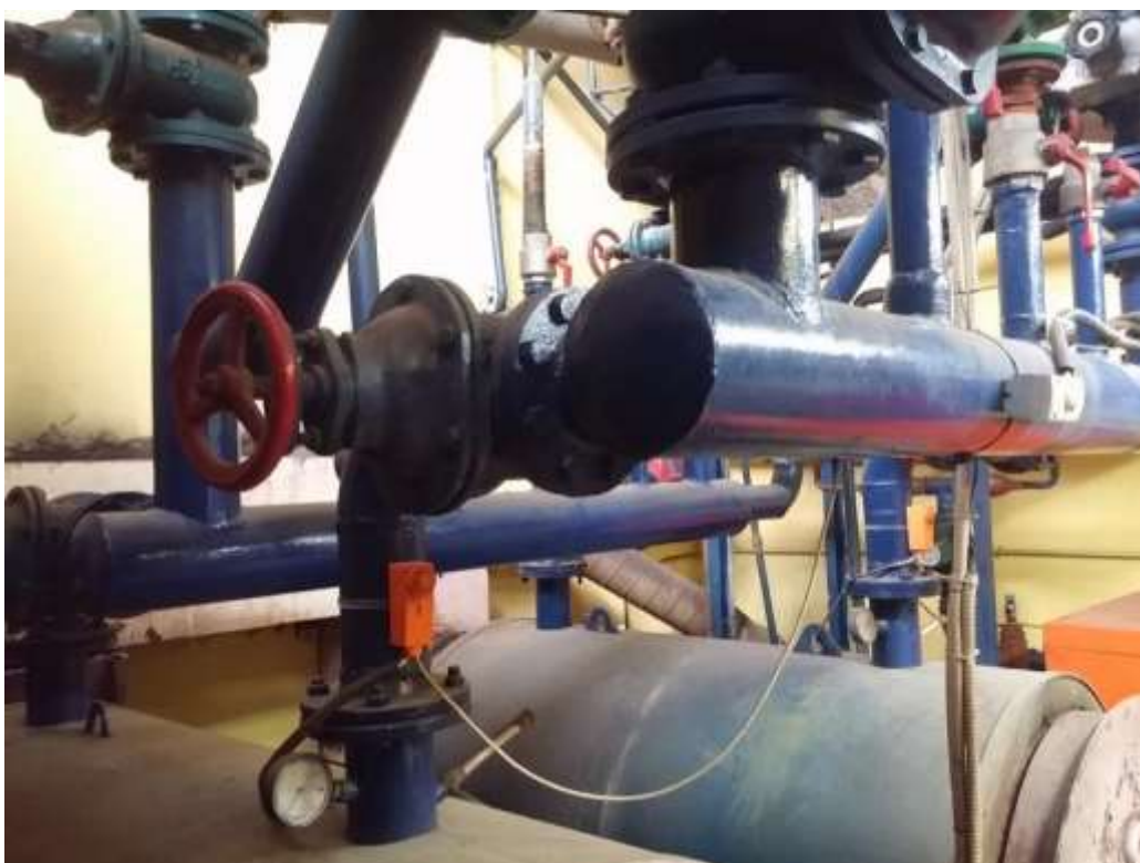
Εικόνα 6. Κεντρικός Συλλέκτης για τη διανομή θερμικής ενέργειας στις εγκαταστάσεις