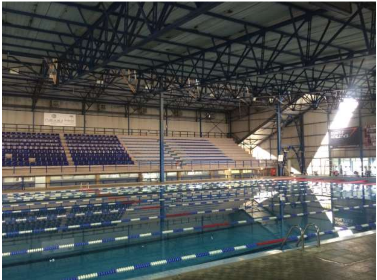
Εικόνα 3. Υφιστάμενη κατάσταση φωτισμού πισίνας

Στον πίνακα που ακολουθεί, παρουσιάζεται το σύνολο των λαμπτήρων εσωτερικού φωτισμού ανά επίπεδο και ανά ισχύ και τεχνολογία λαμπτήρα, αλλά και η συνολική ισχύς του συστήματος φωτισμού. Σημειώνεται ότι η ισχύς των λαμπτήρων φθορισμού καταγράφεται επαυξημένη κατά 10% εξαιτίας των απωλειών στα στραγγαλιστικά πηνία των φωτιστικών τους: