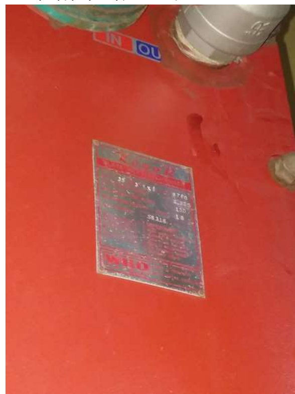
Εικόνα 9. Εικόνες από τον εναλλάκτη της μικρής πισίνας