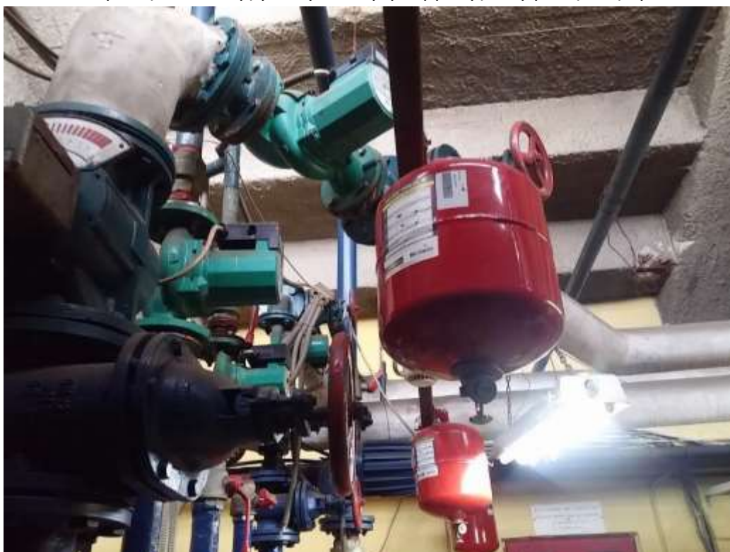
Εικόνα 7. Κυκλοφορητές κλάδων κεντρικού συλλέκτη