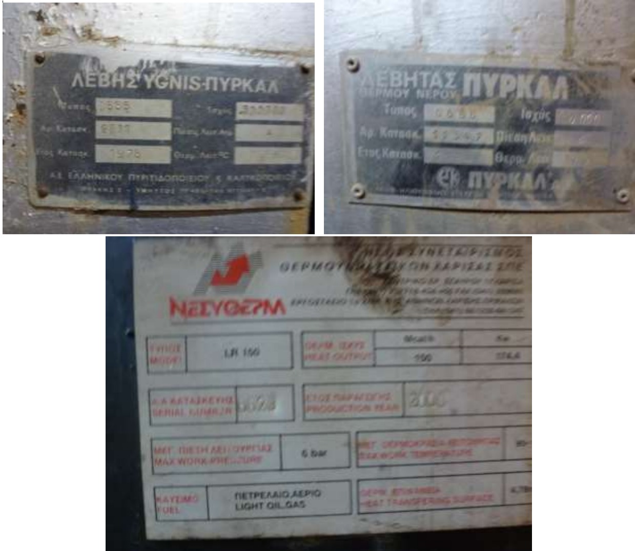
Εικόνα 4. Λέβητες 1, 2, 3 στο κεντρικό λεβητοστάσιο του κολυμβητηρίου