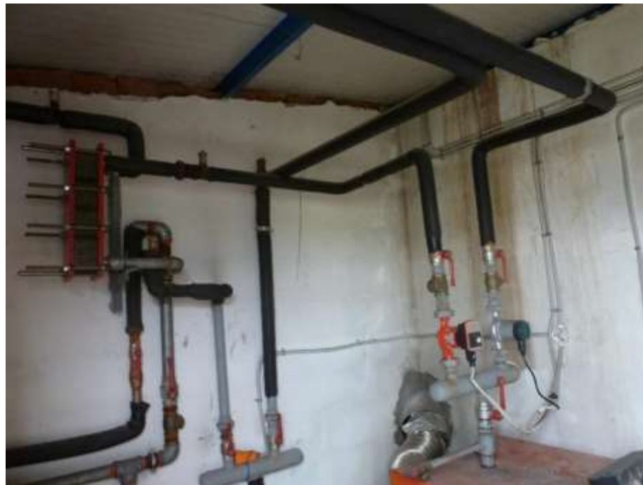
Εικόνα 11. Δίκτυο διανομής λεβητοστασίου αποδυτηρίων μικρής πισίνας